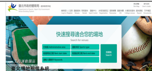
臺北場地租借系統

■ D.運動賽事應用，例如：AR 賽事轉播、沉浸式觀賽、停車位在席引導系統、賽況即時分析、輔助判決等。