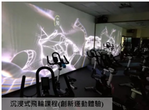
沉浸式飛輪課程(創新運動體驗)

■ A.通用型應用，例如：掃描 QR code 進場、顯示場館入場人數面板、場館租借線上支付系統等。